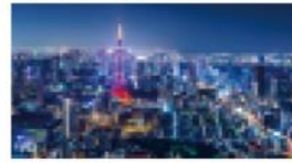
横800×縦480 (WVGA解像度) 画素数: 1,152,000