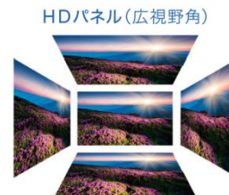
HDパネル(広視野角) 正面からでも、斜めからでも、 くっきり鮮明な映像が楽しめる。

※1：当社製 AV ナビゲーションシステム 7V 型 WVGA モデルとの比較。