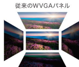
従来のWVGAパネル 見る角度によって 明るさ変化してしまう。