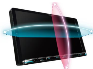
広視野角 上下左右170° ※従来のWVGAパネル→上下120° 左右140°

広視野角 HD パネルの採用により、当社製従来モデル ※1 と比較して約 1.3 倍広い、上下左右 170°のワイドな視野角を実現。色やコントラストの変化が少ないため、運転席・助手席のどちらから見ても色反転が無く、鮮明で美しい映像を楽しめます。