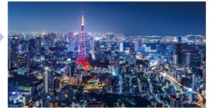
横1280×縦720 (HD解像度) 画素数: 2,764,800