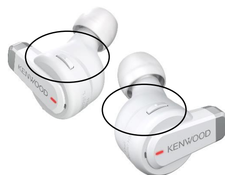
〈「KH-BIZ70T」プッシュ式ボタン〉

各種機能にすばやく確実に切り替えるためのプッシュ式ボタンを本体側面に配置。電源のON/OFFをはじめ、通話時の本機のマイクON/OFF（マイクミュート機能 ※2 ）や、音楽の音量を下げるるとともに周囲の音を取り込むことで装着したまま会話ができるクイックアンビエントなどに瞬時に切り替えることができます。また、音楽リスニングの基本機能（再生/一時停止、曲送り/曲戻し、音量調整）や着信時の通話や終話などは、本機表面に搭載されたタッチセンサーで操作できます。