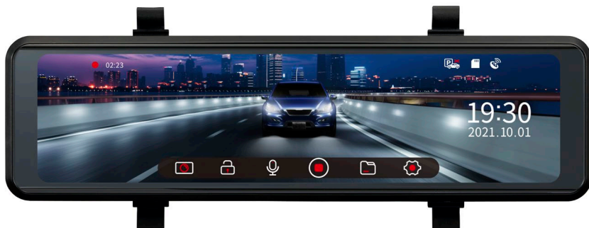
フロント：液晶画面イメージ

● microSD ロゴ、microSDHC ロゴは SD-3C LLC の商標または登録商標です。● Windows®、Windows Media Player は、米国 Microsoft Corporation の米国およびその他の国における商標または登録商標です。● 「Mac OS」は、米国および他の国々で登録された Apple Inc. の商標です。● STARVIS™ は、ソニー株式会社の商標です。● 「ミラレコ」は、株式会社 JVC ケンウッドの商標または登録商標です。● その他、記載されている会社名、製品名は各社の商標および登録商標です。