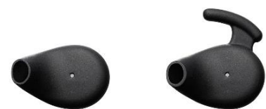
〈標準イヤークリップ(左)とサポート付イヤークリップ(右)〉

イヤークリップは、標準イヤークリップ(S/M サイズ 各 1 個)に加え、より安定した装着感を実現するサポート付きイヤークリップ(右耳用 S/M サイズ 各 1 個、左耳用 S/M サイズ 各 1 個)の 2 種類を付属。好みの装着感や装着スタイルに合わせて選べます。