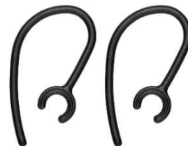
(フレキシブルイヤークック)

イヤークックの形状を自在に変えられるフレキシブルイヤークックを付属。移動中は安定した装着感にする、在宅時は緩めた装着感にするなど好みや利用シーンに合わせて調節できます。着脱が可能で、紛失時に備えてスペアも同梱しています。