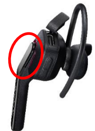
〈マルチファンクションボタン〉