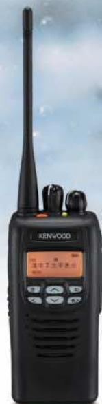
TCP-D203 NEW UHFデジタル簡易無線電話装置