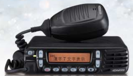
TCM-D204 NEW UHFデジタル簡易無線電話装置